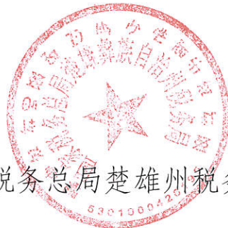
国家税务总局楚雄州税务局