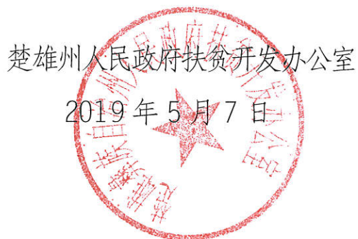
楚雄州人民政府扶贫开发办公室